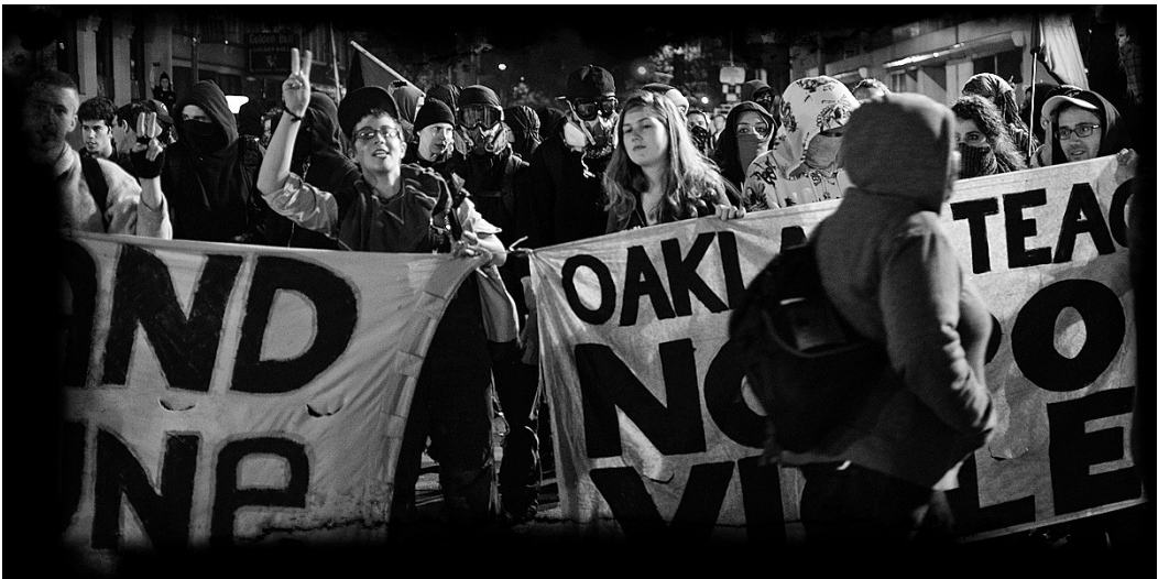
Όκλαντ, 25 Οκτώβρη 2011. Το πανό αριστερά γράφει Oakland Commune : η χαρακτηριστική υπογραφή της συνέλευσης της πόλης.

Είμαστε όμως παραπάνω από απλές συνέπειες της κατάρρευσης του καπιταλισμού. Είμαστε επίσης οι φορείς της συνέπειας. Είμαστε ο αρμός μεταξύ του “εάν” και του “τότε”. Είμαστε αυτό που κάνει αυτό που πρέπει να συμβεί να συμβεί. Αν οδηγούμαστε στην κατάληψη της Oscar Grant Plaza απ’ τη φύση των συνθηκών, αληθεύει επίσης ότι το κάναμε τόσο συνειδητά, με διαύγεια σχετικά με τους σκοπούς μας, και με τις ελάχιστες υπεκφυγές. Ιδρύσαμε έναν χώρο θεμελιωμένο στην ελευθερία του να δίνεις και να παίρνεις κι όχι στην ανταλλαγή, έναν χώρο όπου για τον καθένα υπήρχε ένα γεύμα ή μια σκηνή, ένα εργαστήρι ή μια πολιτική συζήτηση, και αν ήθελε, ανοιχτή συμμετοχή στην κατάληψη σ’ ένα πλήθος διαφορετικών τρόπων (αν και η συμμετοχή δεν ήταν ποτέ και δέσμευση). Και το κάναμε αυτό με ανοιχτή έχθρα προς τους μπάτσους και τις δημοτικές αρχές, αρνούμενοι τις παγίδες τους να μπούμε σε διαπραγματεύσεις με κάθε ευκαιρία. Μια τέτοια κομμούνια μπορεί να προκύψει μόνο μέσα από κάθε είδους φροντίδα, προσοχή, θέληση, αποφασιστικότητα και προσπάθεια. Αυτός ο χώρος ήταν, από πολλές απόψεις,